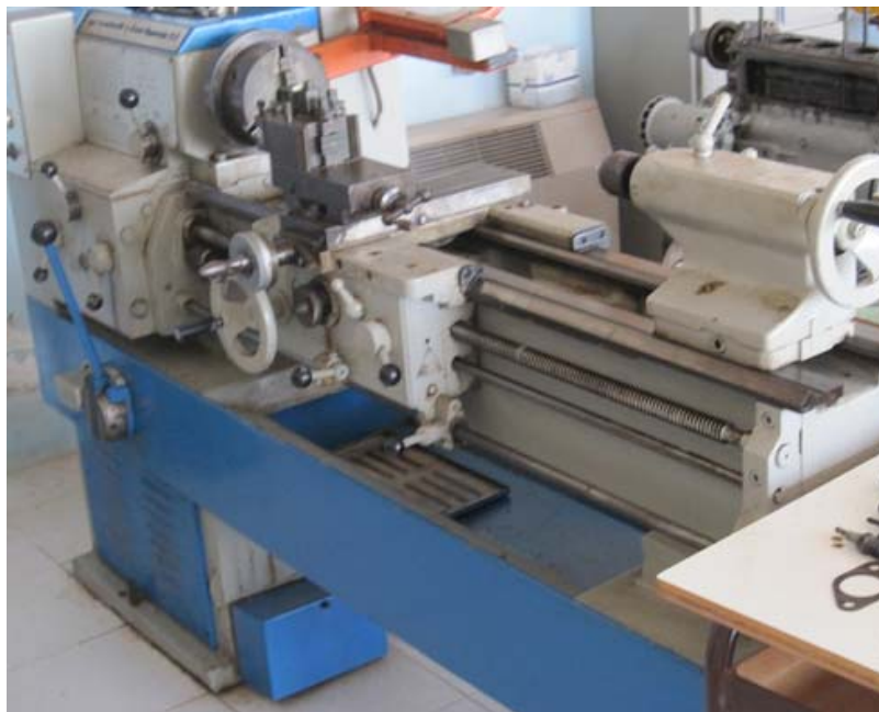
Immagine GRAZIOLI TIPO FORTUNA 150

COLLOCAZIONE BANCO: Via Panoramica 81, Porto Santo Stefano (GR), cap 58019.