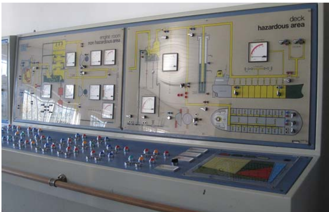
Immagine simulatore controllo produzione gas inerte (non funzionante)

COLLOCAZIONE BANCO: Via Panoramica 81, Porto Santo Stefano (GR), cap 58019.