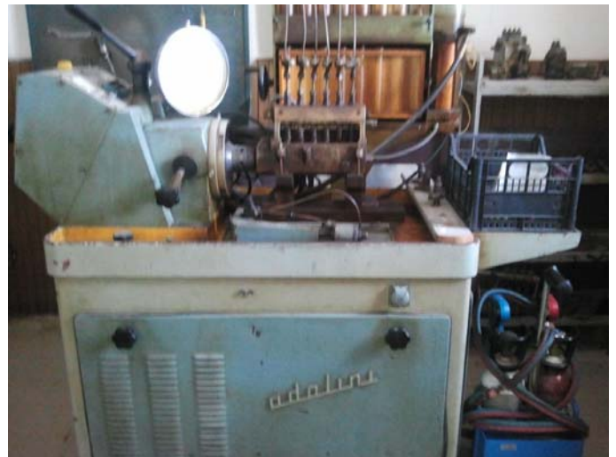
Immagine banco prova via Civinini