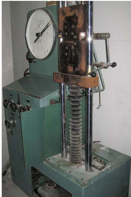
Immagine macchina prova materiali

COLLOCAZIONE BANCO: Via Panoramica 81, Porto Santo Stefano (GR), cap 58019.