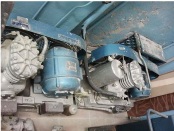
Immagine coppia di compressori "Dorin"

COLLOCAZIONE BANCO: via Civinini, Porto Santo Stefano (GR), cap 58019.