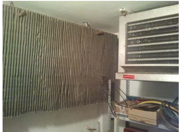
Immagine fascio tubiero evaporatore