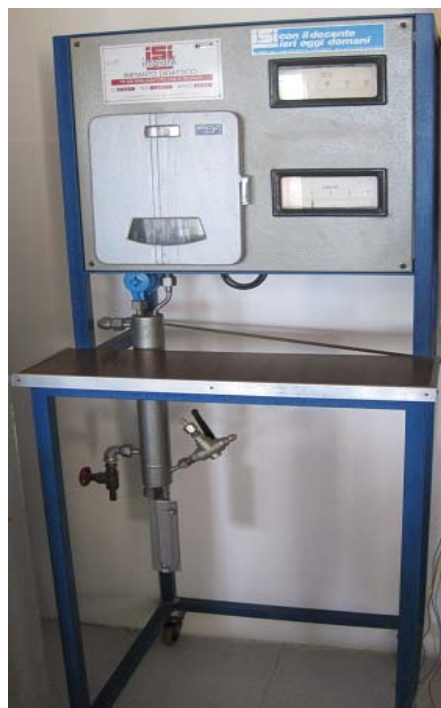
Immagine analizzatore fumi (non funzionante)

COLLOCAZIONE BANCO: Via Panoramica 81, Porto Santo Stefano (GR), cap 58019.