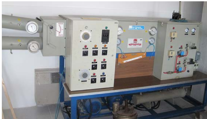
Immagine banco prova frigo.

COLLOCAZIONE BANCO: Via Panoramica 81, Porto Santo Stefano (GR), cap 58019.