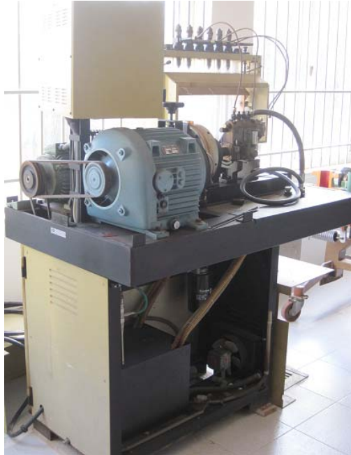
Immagine banco prova via Panoramica

COLLOCAZIONE BANCO: via Civinini, Porto Santo Stefano (GR), cap 58019.